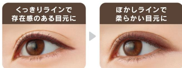
※仕上がりに個人差があります。

ぼかしチップをお使いいただくことで、くっきりラインを柔らかい印象の目元に上げることが出来ます。つけてから30秒以内にぼかしてください。チップの先端はとがった使いやすい形状なので、細かいメイク直しにも最適です。また、アイシャドウとなじませてお使いいただくことも出来ます。