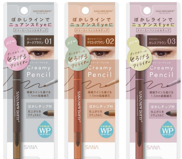
(写真左から) サナ ニューボーン クリーミーアイペンシル E X 01～03 各1,000円(税込1,100円)

カラーは、ニュアンスのある目元に仕上げる3色「01 ダークブラウン」、「02 テラコッタブラウン」、「03 カシスブラウン」です。アイライン初心者の方やカラーライナーに抵抗のある方でも取り入れやすい絶妙な大人カラーが揃いました。お出かけにはもちろん、おうち時間などの日常使いとしてお使いいただいても、トレンド感のある印象的なまなざしをさりげなく演出します。