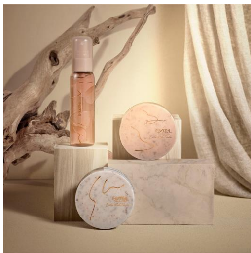
(写真 左下・中央) サナ エクセル エクストラリッチパウダー '22 01・02 各20g 2,400円（税込2,640円） (写真 左上) サナ エクセル セッティングオイルミスト 75mL 1,200円（税込1,320円）