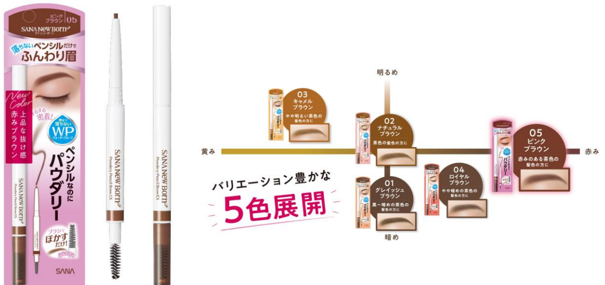
サナ ニューボーン パウダリーペンシルブロウEX 05（ピンクブラウン） 850円（税込935円）