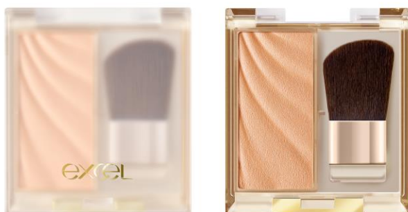
(写真:エクセル ドレープド シマーグロウ DS03)