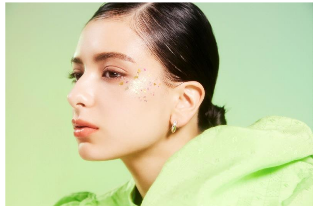
モデル使用色 エクセル スキニーリッチシャドウ SR06、 エクセル パウダー&ペンシル アイブロウEX PD07