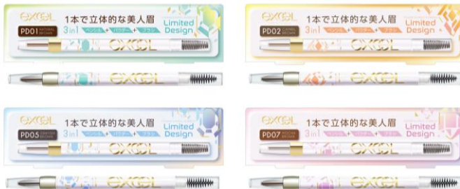
エクセル パウダー&ペンシル アイブロウEX ( '23) PD01(左上)・PD02(右上)・PD05(左下)・PD07(右下)