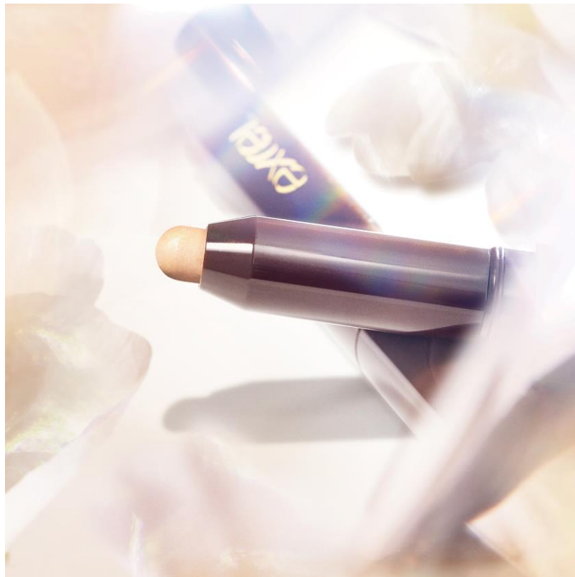
GF12 (アミュレットブーケ)

「アミュレットブーケ」の色名の通り、塗るだけでどんなアイメイクもぱっと華やぎ、願いをも輝かせるようなカラーに仕上げました。