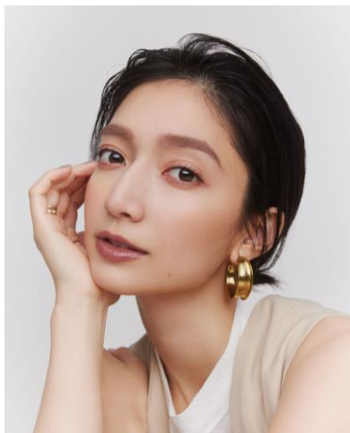
モデル使用色: サナ ニューボーン カラーリングブロウマスカラ 03