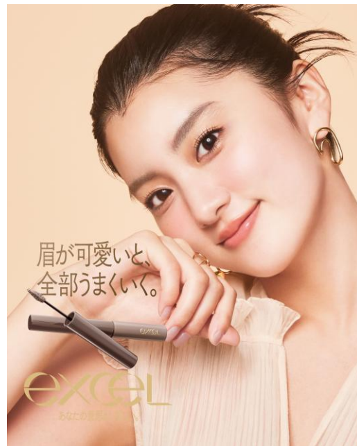
サナ エクセル フェードブロウマスカラ F B 0 1～F B 0 4

「フェードブロウマスカラ」は、 眉マスカラが苦手な方でも簡単に使える、ふんわり軽やかな仕上がりを叶える“失敗知らず”の眉マスカラ です。液が付きすぎたり、ムラになったりしやすい眉マスカラの不満点を見直し、 誰でも自然で抜け感のある眉に仕上げます。