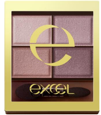
エクセル スキニーリッチシャドウ SR14（クラッシィブラウン）

「SR14（クラッシィブラウン）」の、青みとブラウンの程良いバランスをベースに、左下のまろやかなピンクブラウンを深みのあるトープブラウンに調整。透明感のある上品なカラーに仕上げました。