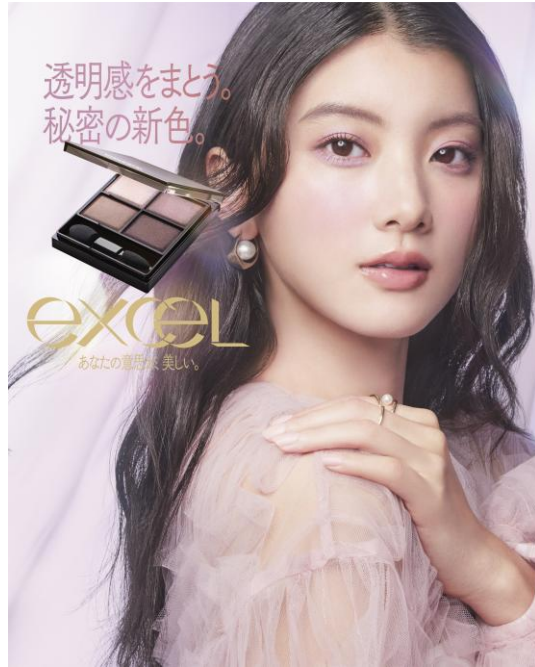
サナ エクセル スキニーリッチシャドウ N SK08

2026年2月にリニューアル発売した「スキニーリッチシャドウ N」は、ブランドの看板アイテム「スキニーリッチシャドウ」の色展開・ツヤ感・密着力をすべてアップデートさせた新アイシャドウ。リニューアルでは、パレットの4色それぞれの美しさや発色、濃淡までを徹底的に見直し、グラデーションだけではなく、もっと自由にメイクを楽しめるアイシャドウへと進化しました。