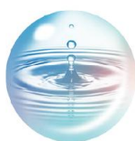
グリシルグリシン ※4