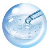
ナイアシンアミド