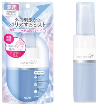
サナ インプリファイン スキンバリアフィクサー 【医薬部外品】 80mL 1,200円（税込1,320円）