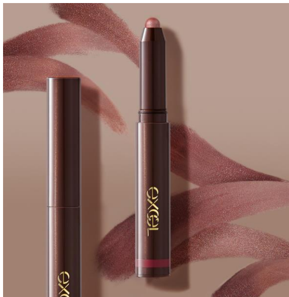
サナ エクセル グリームオンフィットシャドウ GF06 (ワイングラス) 1,200円 (税込 1,320円)

既存品5色に追加となる、この度の新色「GF06(ワイングラス)」は秋らしさもありつつ使いやすさ抜群のパーガンディカラー。ベースのパーガンディに青パールやゴールドパールをプラスした、しなやかで芳醇なブラウンレッドです。締め色や目尻のみのポイント使いでも、アイホール全体にも使える万能カラーとなっております。