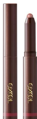
(写真: エクセル グリーンオンフィットシャドウ GF06)