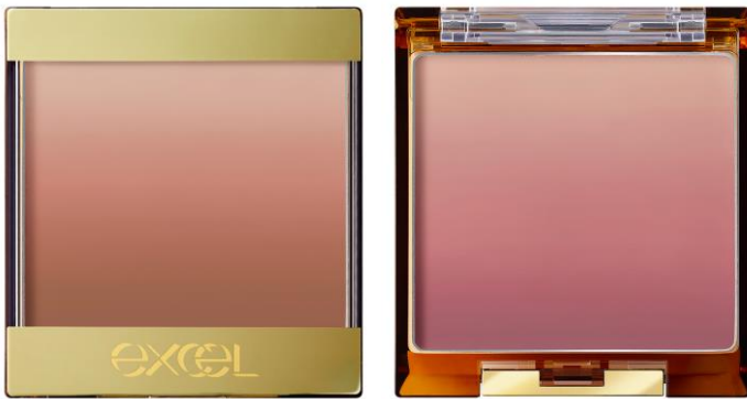
(写真左から:エクセル オーラティック ブラッシュ AB06、AB07)