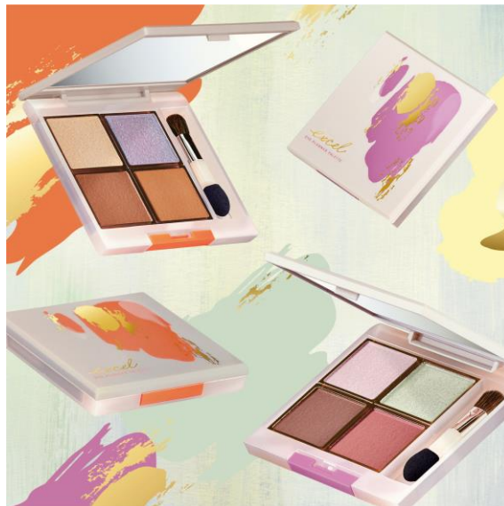
(写真上から) サナ エクセル アイプランナーパレット 01 ('23)・同 02 ('23) 各 2,500円(税込 2,750円)

お好みに合わせて使い分けられるオリジナルチップ&ブラシを採用。パーティーの華やかさを想起させる、カジュアルアートをあしらった開放感あふれるポジティブなデザインに仕上げています。