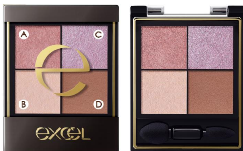
(画像: エクセル リアルクローズシャドウ CX03)