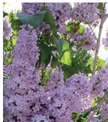
ライラックの花。札幌の木として指定されている。