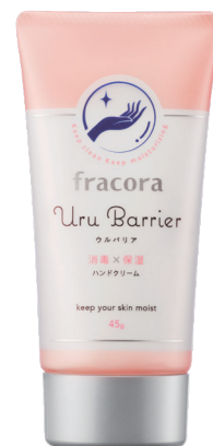
ウルバリア 『Uru Barrier』 指定医薬部外品

空気が乾燥し、季節トラブルが気になる季節。新しい生活様式の中で手指を消毒する機会が増えていますが、刺激の強い消毒を1日に何度も繰り返すと手荒れを引き起こしてしまうことも。特にフラコラのお客さまであるミドルエイジの女性は家事や育児、介護に携わることも多い分、手を洗う回数も増え、特に手が荒れやすい傾向にあります。手が荒れると、肌本来のバリア機能が崩れ、殺菌・消毒してもその効果を阻害してしまうことも。手肌を清潔に美しく保つには、消毒に加え、適切なハンドケアが必要です。そこで、手指の消毒をしながら同時にうるおいを与えるハンドクリームを開発いたしました。