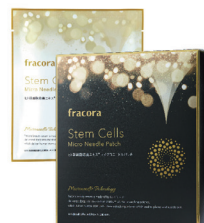
『ヒト幹細胞培養エキス マイクロニードルパッチ』