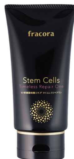
『ヒト幹細胞培養エキス タイムレスリペアワン』

「吸水スフィア *7 」とは、低分子ヒアルロン酸とコンニャク成分でできた微小な球体で、肌で瞬時 *3 に膨潤して年齢サイン *8 をふっくらさせる美容成分です。