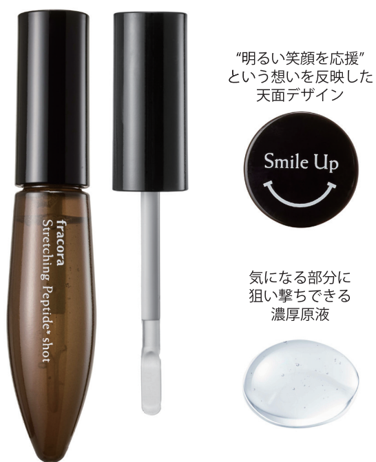
ストレッチングペプチドショット 『Stretching Peptide shot』

当社はこれまで表情筋に着目したトレーニングやサプリメント、スキンケア製品で、トータルリフトケアを提案してきました。そんなフラコラだからこそ、年齢サインやハリ低下などの表情グセをただケアすればいいという発想ではなく、大人の真の美しさ、チャーミングな表情美を追求。特に“年齢感”や“不幸”な印象を与える目周り口周り、眉間の下向きの表情グセポイントにダイレクトにアプローチ。笑顔になったときに自然に生まれるチャームポイントが美しく映える肌へと導く新発想のリフトケア&ハリのあるお肌へと導きます。