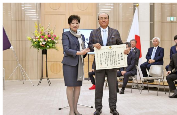
2019年度東京都スポーツ推進モデル企業授賞式の様子

一方、「美と健康を提供するなら、まずは自分達から」と考え、社長も含めた全従業員がまずはエクササイズを実施。2011年から9年以上、毎朝取り組み、 2019年度には、上位11社に与えられる「東京都スポーツ推進モデル企業」にも選定 されました。