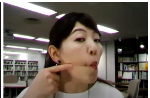
顔のエクササイズの様子

※1 2020年の「fracora オンライン朝活」の累計参加（株）協和調べ ※2 2010~2020年のイベント累計参加（株）協和調べ ※3 Davidson, R. J., Kabat-Zinn, J., Schumacher, J., Rosenkranz, M., Muller, D., Santorelli, S. F., Urbanowski, F., Harrington, A., Bonus, K., & Sheridan, J. F. (2003) Alterations in brain and immune function produced by mindfulness meditation. Psychosomatic Medicine, 65, 564-570.