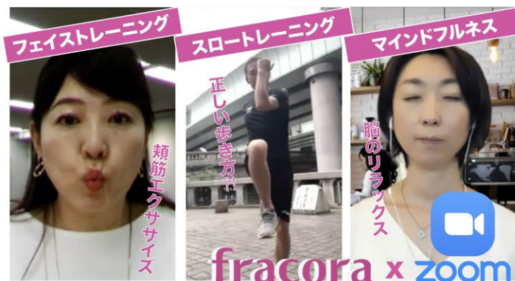
オンライン朝活：身体とココロに効く 朝の 3 種のエクササイズ

専門家によるライブ配信、週ごとのテーマ設定で、毎日楽しく参加できるイベントを開催しています。