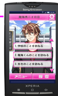
SO-01B Sensuous Black