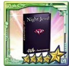
UR「メモリアルアルバム」