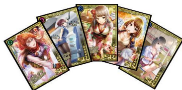
トレーディングカード(ブラインド/ 全24種) 価格: 200円(税抜)