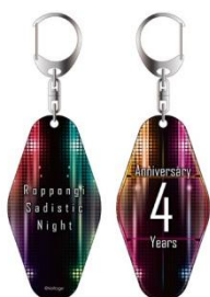
4周年記念キーホルダー 価格: 1,000円(税抜)