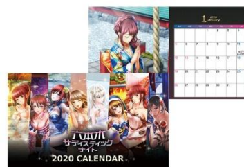
カレンダー 価格: 1,500円(税抜)