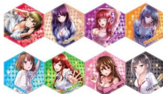
アクリルキーホルダー(全8種) 価格: 各800円(税抜)