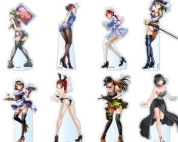
デカアクリルスタンド(全8種) 価格: 各1,800円(税抜)