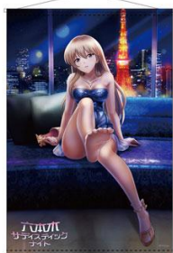
B2タペストリー(全8種) 価格: 各3,000円(税抜)