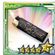
UR「メモリアルNightJewelライター」