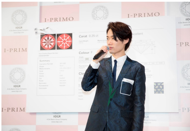
IIDGR 鑑定書に記されたハート&キューピットに興味津々