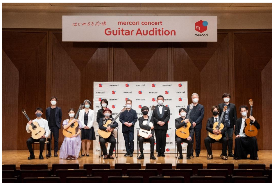
クラシックギター部門6名とオールギター部門グランプリ1名、計7名が参加

株式会社メルカリ(以下、メルカリ)は、2021年4月21日(水)サントリーホールにて、「メルカリコンサート ギターオーディション」本選を開催しました。本オーディションは、コロナ禍で「メルカリ」を通じた楽器の取引量が増えたことを受け、ギター演奏にはじめて挑戦する方、演奏家でオーディションに挑戦してみたい方など、先行きが見えづらい時代でも、前向きに新しいチャレンジをする方を応援したいという思いから開催しました。