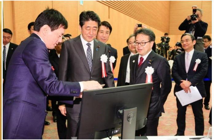
※出典：平成30年2月26日 第4回日本ベンチャー大賞表彰式 | 平成30年 | 総理の一日 | 総理大臣 | 首相官邸ホームページ