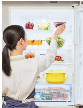
<使いやすい冷蔵室棚(イメージ)>