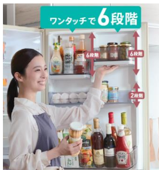
<フリードアポケットの使用(イメージ)>

高さが異なる調味料や飲料等が入るドアポケットは、冷凍冷蔵庫の中でも整理整頓のニーズが高くなっています。そこで、様々な大きさの食品に合わせて、6段階に高さを調節できるスライド式「フリードアポケット」を上段2か所に採用。扉から外さなくても片手で簡単に位置を変えられます。さらに、2段階に調節できる中段ドアポケットを含めると72通りの組み合わせになり、あと少しの高さで物が入らない等の悩みを解決します。また、汚れが気になった際はドアポケットを簡単に取り外してお手入れできるので安心して使用できます。