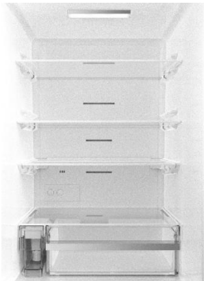
<明るい室内(イメージ)>