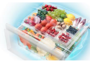
<うるおいラップ野菜室(イメージ)>