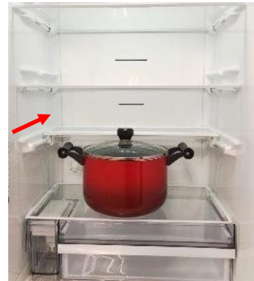
<アクション棚スライド時(イメージ)>