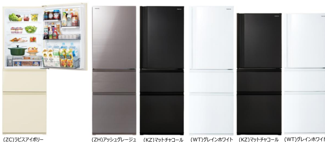
(ZC)ラピスアイボリー

*301～400Lクラス国内家庭用ノンフロン冷凍冷蔵庫において 2020年11月18日現在 当社調べ