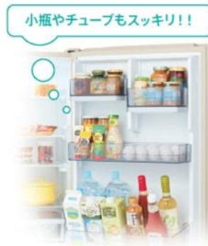
<食品の収納(イメージ)>