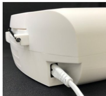
奥行きを取らない横挿しの電源コード