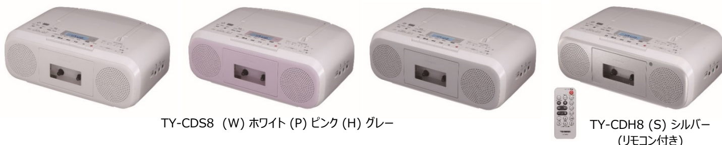
TY-CDS8 (W) ホワイト (P) ピンク (H) グレー

当社のスタンダードCDラジカセは、2015年の発売以来、国内市場でトップレベルの累計67万台以上※2を売り上げています。 6年振りにフルモデルチェンジした新製品は、スピーカー出力を2.0W+2.0Wへ強化。気分や楽曲に合わせて選べる「4つの 音質モード」、操作性・視認性を改良させた大きなボタンなど、使い勝手にもこだわりました。