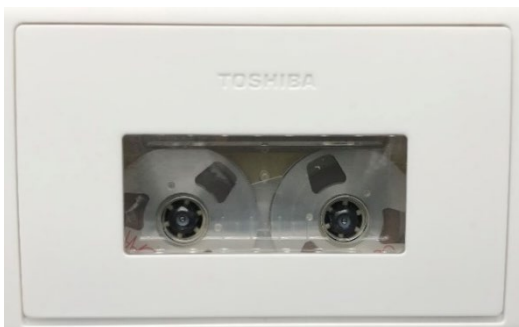
テープの残量が確認できる大きなカセット窓