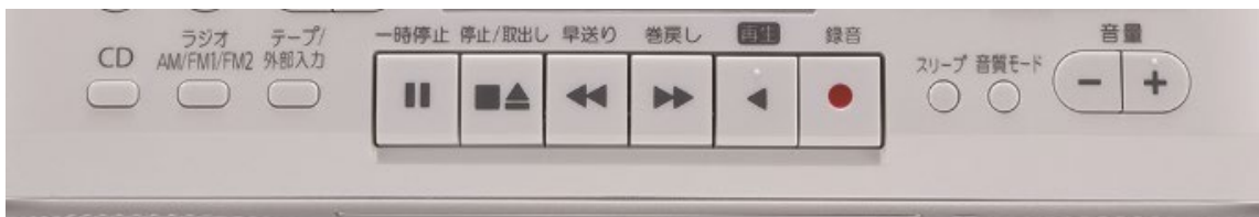
見やすく押しやすいボタン

大きく押しやすい「デカボタン」、テープ残量の確認に便利な「目盛り付きの大きなカセット窓」を新たに採用しました。また、AC電源コードは、従来の製品後部より側面に移動したことにより、奥行きを取らずに置くことができます。