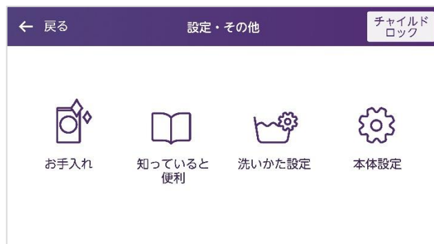
「設定・その他機能」選択画面イメージ