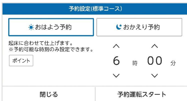
「おはよう予約」「おかえり予約」選択画面イメージ