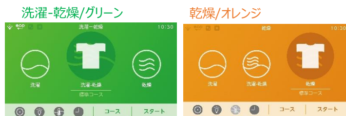
機能ごとに色分けされているので一目で分かりやすい