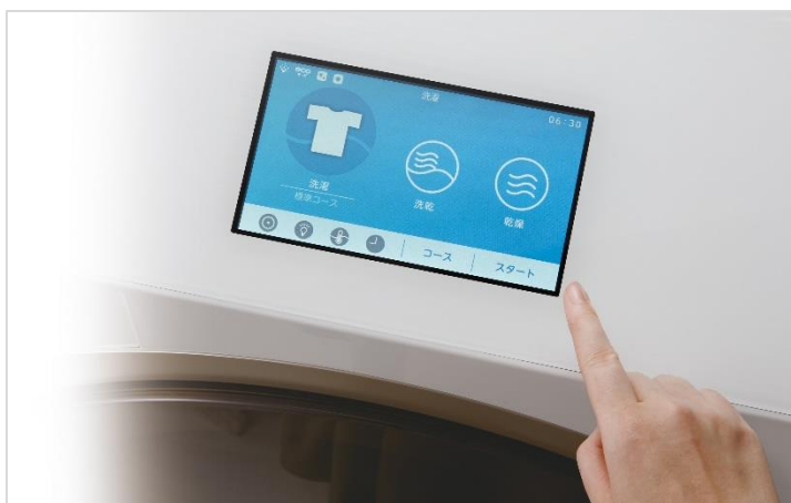
スマートフォン感覚でアイコンをタッチして、カンタン操作