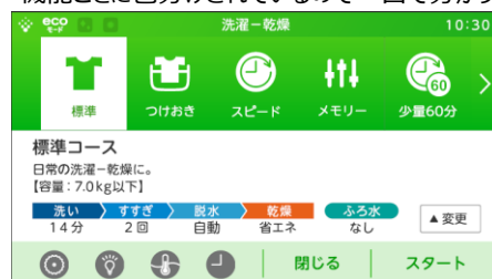
「使用場面」・「容量」・「運転内容」を一覧で表示