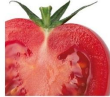
「トマト断面の乾燥比較(当社比)」(イメージ)