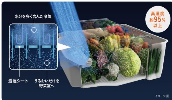
「ミストチャージユニット」(イメージ)

「もっと潤う 摘みたて野菜室」は、プラチナ触媒を追加した「ミストチャージユニット」の搭載により、うるおいたっぷりの冷気を1日20回以上 注2 循環させながら、水蒸気だけを通し冷気が直接野菜に当たることを防ぎ、野菜に最適な約95%以上 注3 の高温湿度環境を保ちます。まとめ買いの野菜も本来のシャキッとした食感と彩り、栄養素も維持します。