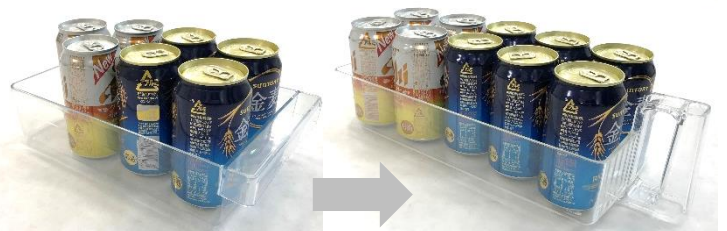
「従来のフリーケース」(イメージ)

握りやすいグリップ式の持ち手を採用し、出し入れしやすくなった新「フリーケース」は、容量も従来よりも約0.8L増量 注6 、350ml缶なら3本分多い、10本収納することが可能になりました。卵の収納や細々とした食品類の収納にも便利で、庫内の整理にも役立ちます。