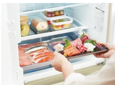
「選べる 切り替えチルド」(イメージ)