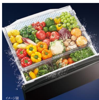
「もっと潤う 摘みたて野菜室」(イメージ)