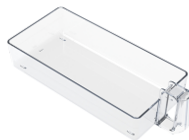
「新フリーケース」(イメージ)