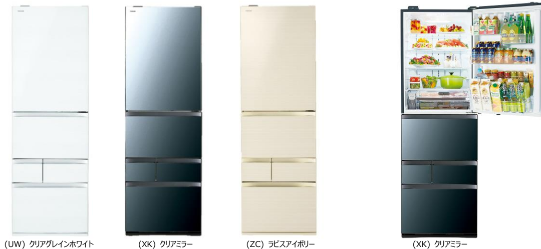
(UW) クリアグレイホワイト