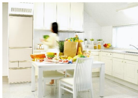
使用シーン(イメージ)