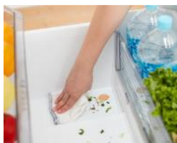
「おそうじ口」(イメージ)