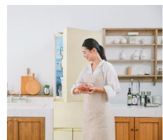
「タッチオープンドア」(イメージ)