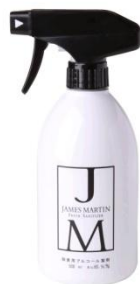
トリガー付 500ml ¥1,239 (税抜)