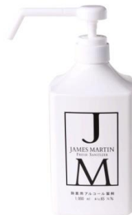
シャワーポンプ付 1000ml ¥2,000 (税抜)