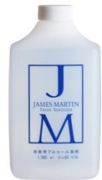
詰め替え式 1000ml ¥1,800 (税抜)