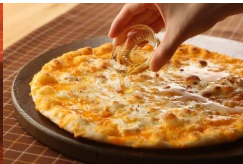
『7種のチーズ ハチミツ添え』

「土鍋パスタSPALA」は、店内で製麺・熟成させ旨味が詰まった、もちもち食感の生パスタが特徴のお店です。1月29日(水)より開催する「とろ～りチーズフェア」では、「とろける7種のチーズのカルボ」、「クリームチーズのトマトソース」など人気のパスタメニューや、期間限定で販売するピザ「7種のチーズ ハチミツ添え」など冬にぴったりのチーズを使用した熱々の全3商品をお召し上がりいただけます。