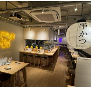
串かつとお酒 でんがな 中目黒店