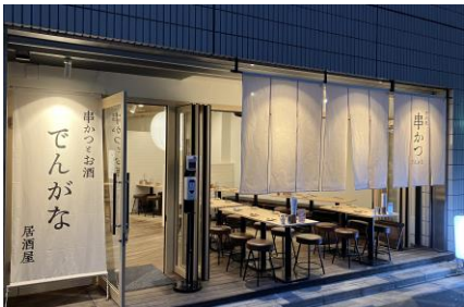
串かつとお酒 でんがな 池袋東口店