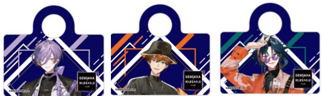
オリジナルピック一例