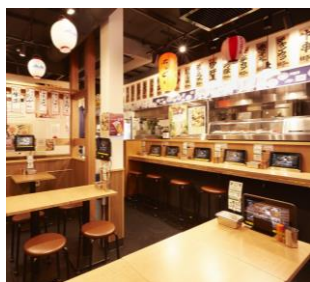
串かつ でんがな 金山小町店