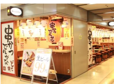
串かつ でんがな 大阪駅前第4ビル2号店

➤ ネオ居酒屋「串かつとお酒 でんがな」 大衆酒場のレトロな風情を残しつつ現代風のモダンでお洒落な雰囲気が味わえるお店です。2世代から居酒屋を知り尽くしたサラリーマン層まで幅広い方に向け、定番の串かつメニューに加え、同店限定メニューをご用意し、都内(池袋、下北沢、高円寺、荻窪、新宿、町田、吉祥寺、中目黒)と神奈川県(桜木町)の全9か所に出店しています。