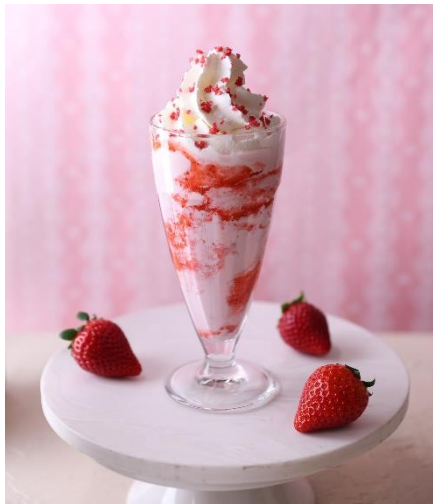
ストロベリーシェイク