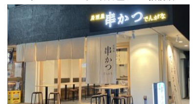
串かつとお酒 でんがな 下北沢店