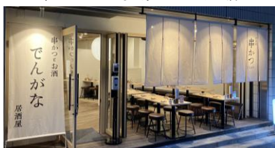
串かつとお酒 でんがな 池袋東口店