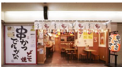
串かつ でんがな 大阪駅前第3ビル2号店