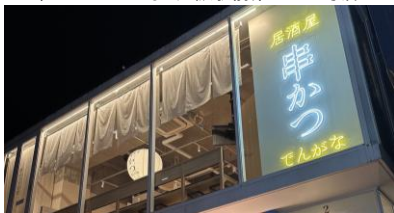
串かつとお酒 でんがな 吉祥寺店