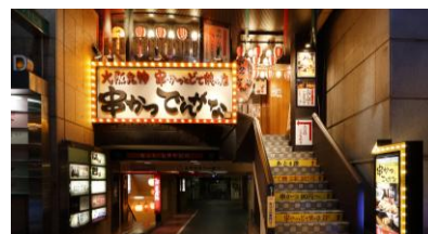
串かつ でんがな 名古屋テレビ塔前店