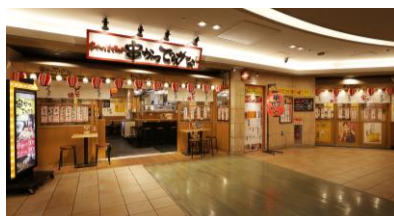
串かつ でんがな あべのルシアス店