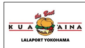
イメージ図： ららぽーと横浜店限定オリジナルステッカー

「クア・アイナ ららぽーと横浜店」は国内34店舗目の出店となります。これを記念し、4月27日(水)～5月1日(日)の期間、毎日先着34名様に「ららぽーと横浜店限定オリジナルステッカー」をプレゼントいたします。