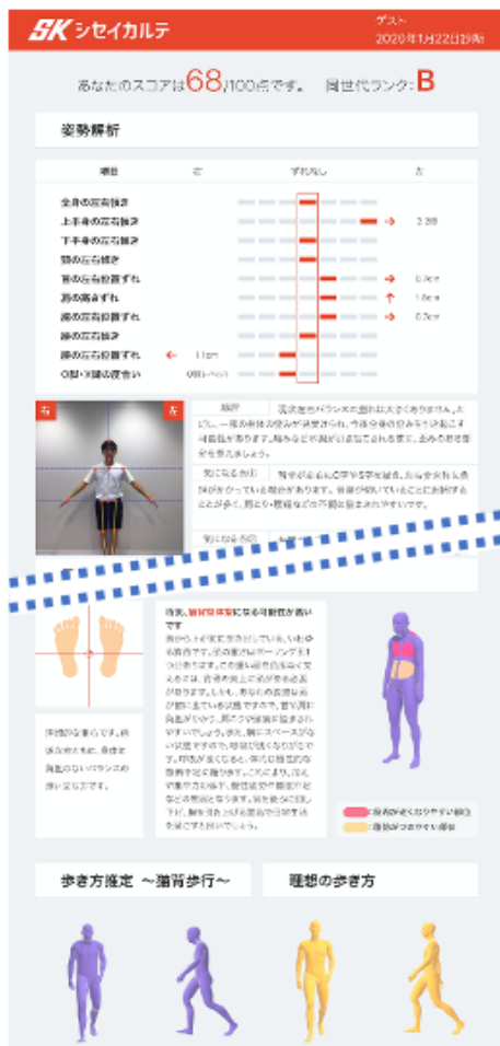
▲シセイカルテ分析レポートイメージ

「シセイカルテ」は、「お客様の姿勢を可視化したい」という要望にお応えして2020年1月に誕生して以降、全国の整骨院・接骨院・整体院・鍼灸院・フィットネス・パーソナルジム・スポーツクラブ・エステ・歯科医院といった業界の方々に導入いただいております。施術・レッスンの効果を誰にでも分かりやすい形で可視化（数値化、データ化、3Dモデル化）することで、現場スタッフとおお客様の信頼関係構築をサポートし、この度サービス開始から7ヶ月間（8月10日時点）で、ついに累計分析件数が10,000件を突破しました。