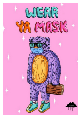
WEAR YA MASK