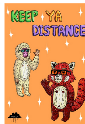
KEEP YA DISTANCE