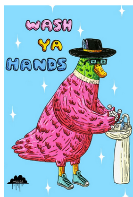
WASH YA HANDS

新型コロナウイルスの収束を願い、MULGA が感染対策を伝えるための3つのイラスト「手を洗おう」「マスクをつけよう!」「距離をとろう!」を制作、無償提供し、話題となった作品たち。