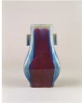
《火焰紅双耳方壺 「大清乾隆年製」銘》 景德鎮窯 清時代 18世紀 ポーラ美術館蔵