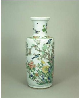
《五彩花鳥文瓶 (康熙五彩)》 景德鎮窯 清時代 17-18世紀 ポーラ美術館蔵

さまざまな「器」の内奥にかすかに響く「声」をマイクでとらえ、音楽を紡ぎだすインスタレーション。ポーラ美術館の東洋陶磁との間には、どのようなセッションが生み出されるのでしょうか？