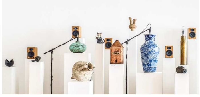
オリヴァー・ビア《悪魔たち》(部分) 2017年 フォーリンデン美術館蔵 (ワッセナー、オランダ)