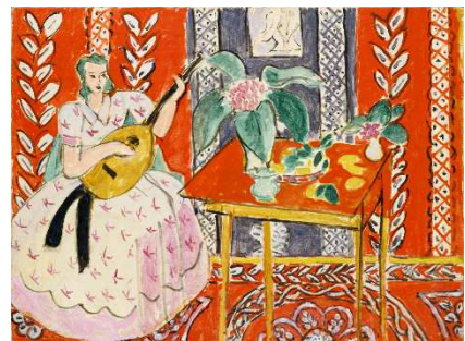
アンリ・マティス 《リュート》1943年 ポーラ美術館蔵