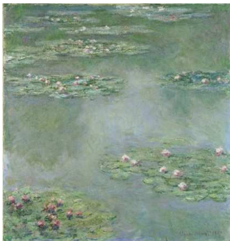
クロード・モネ《睡蓮》1907年 ポーラ美術館蔵

美術館の中に作られた円形プールの水面をゆったりと漂う白いボウルの数々。陶器がぶつかることで偶発的に奏でられる音色と、水の流れによって絶え間なく移り変わる光景は、モネが絵画に描きとどめた水面のきらめきに呼応するかのようです。