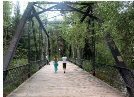
スーザン・フィリップス《ロング・ゴーン》2006年 2チャンネル・サウンド・インスタレーション Installation view: Aspen Art Museum, 2008

サウンド・アートを牽引するアーティスト、スーザン・フィリップスが、森の遊歩道で「音」の新作インスタレーションを展開。箱根での滞在を経て制作された幻想的な音色が、森の奥に響き渡ります。