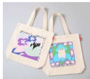
オリジナルイラストトートバッグ (2種) 各¥3,900