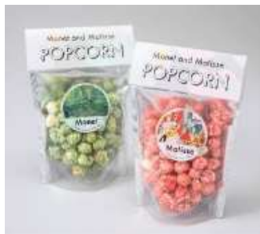
オリジナルプレミアムポップコーン 各¥500