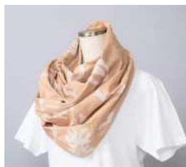
マティス《オセアニア 海》のストール ¥9,900