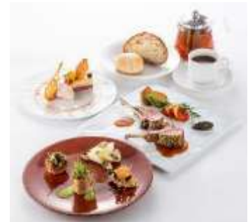
特別コースメニュー