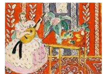
上：クロード・モネ《睡蓮の池》1899年 下：アンリ・マティス《リュート》1945年 ともにポーラ美術館蔵