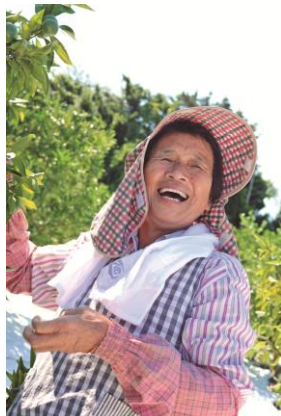
小学生の部グランプリ 「かがやくえがお」