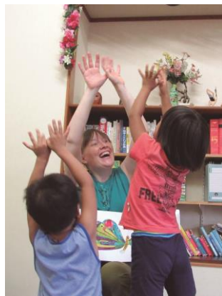
中学生の部グランプリ 「英語の絵本」