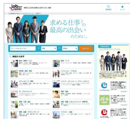
『Job ギアキャリア PORTAL』

名称 : Job ギアキャリア 概要 : キャリア採用特化型採用ホームページ構築 サービス・求人ポータルサイト 求人ポータルサイト URL : https://job-career.jp/ ご利用料金 : 年間契約:840,000 円(税別)