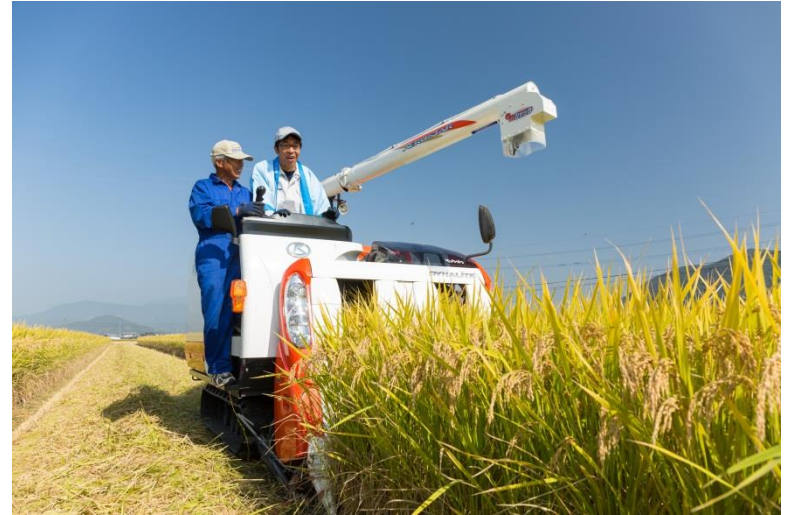
●コンバインでの稲刈り *写真は武雄市長