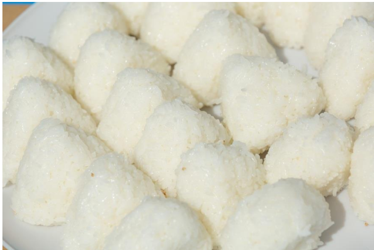
●新米「さがびより」のおにぎり