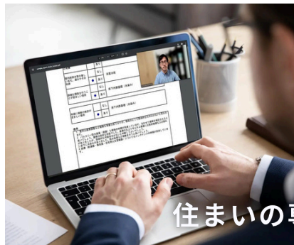
住まいの専門家相談