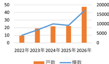
※1. 超高層マンションの完成（予定）数／首都圏

また新築マンションの施工品質は2000年以降徐々に改善が見られ、マンションにおける主要な社会課題は適切な維持管理にシフトしています。適切な維持管理のベースともなる長期修繕計画について購入者の理解が追い付いていない、また修繕積立金が不足する管理組合が多いといった課題について、新築時から購入者への理解を促し関心を高めることがますます重要になっている今、ホームインスペクションだけでなく、マンション管理コンサルティングの事業展開もしている当社だからこそ、新築マンション購入者に提供できる価値を見直し、これまでの新築マンション内覧会立会いサービスをより拡充させた新サービスを提供することにいたしました。