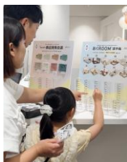
店頭での投票の様子