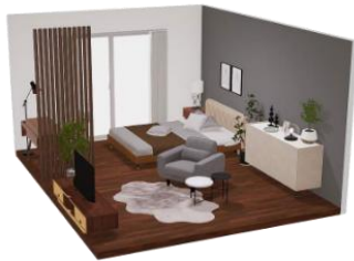
＼ #おくROOM選手権 初代優勝者Anzu様制作のお部屋