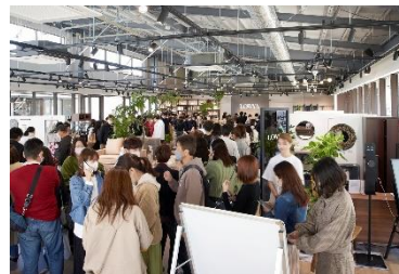
今年4月に福岡市西区に開業したLOWYA九大伊都店

そして今回は全国展開の第一歩として、関西エリアの主要ターミナル駅である「難波」に直結している「なんばパークス」に2店舗目となる実店舗を構えることとなりました。今後ともより一層お客様の声に向き合い、多様なライフスタイルを提案していけるブランドを目指してまいります。詳細な店舗情報につきましては情報が整い次第、発表いたしますので、乞うご期待ください。