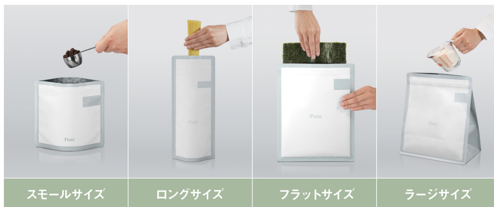
Fluto食品保存袋 全4サイズ

用途に合わせて選べる4つのサイズ展開をご用意しました。スモールサイズはお米やコーヒー豆の保存に、ロングサイズはパスタなどの乾麺に、フラットサイズは食パンや海苔の保存に最適です。どのサイズも統一されたデザインで、キッチンインテリアをすっきりとまとめくれます。毎日の食材管理がより便利に、そしてスタイリッシュに変わります。鮮度を保ちながら、キッチンも美しく整える、新しい食材管理をぜひお試しください。