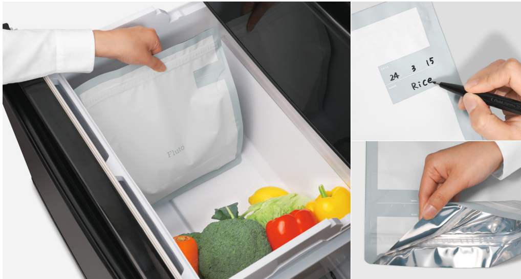
Fluto食品保存袋 ラージサイズ

新たに販売するFluto食品保存袋は、お米を長期間新鮮に保つために最適な保存袋です。一般的に小売店で販売されている米袋には、荷崩れ防止のために小さい穴が開いていますが、これは長期保存に適していません。なぜならば、虫が侵入する可能性や、周囲の臭いが米に移りやすくなる恐れがあり、さらに光や酸素の影響でお米の品質が劣化しやすくなるからです。