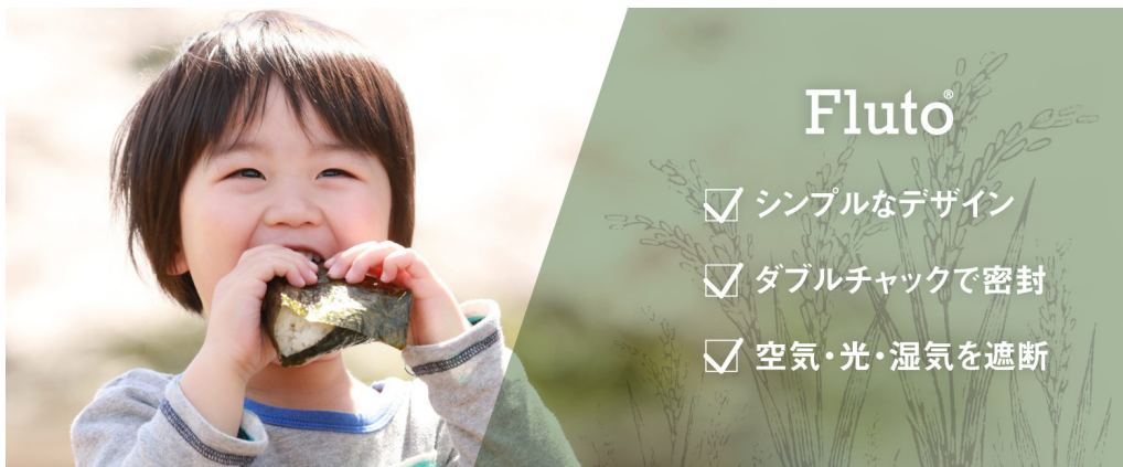
Fluto食品保存袋 の特徴

また、ホワイトのマットな質感とシンプルでおしゃれなデザインが特徴で、どんなキッチンにもマッチ。マチ付きで自立するため、省スペースでスリムな収納が可能です。油性ペンで日付や内容物を記入できるため、お米以外の食材の整理整頓にも便利。