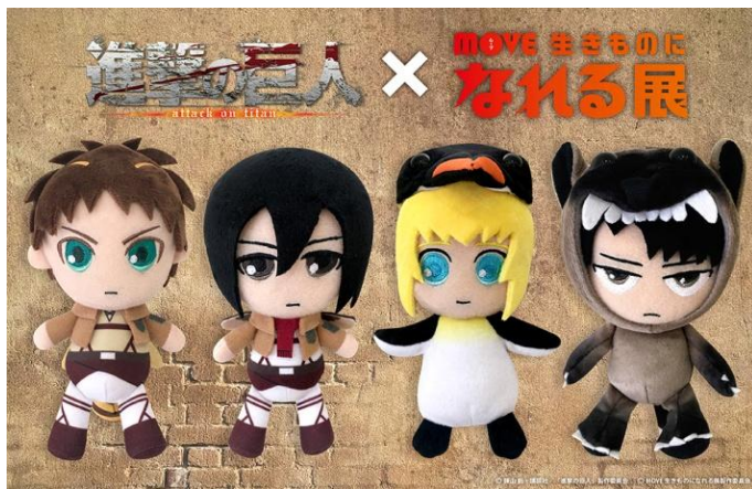
「生きものになりきり！コラボキーチェーンぬいぐるみ」