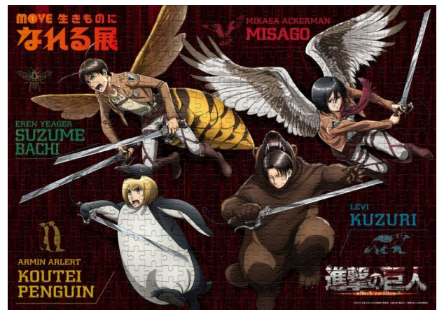
「MOVE 生きものになれる展×進撃の巨人 ジグソーパズル」

©諫山創・講談社／「進撃の巨人」製作委員会 ©MOVE 生きものになれる展製作委員会 ※ご掲載頂く際には上記コピーライト表記の記載をお願い申し上げます。