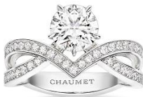
「ジョゼフィーヌ」コレクション アムール デグレット リング

ショーメのアイコンである「ジョゼフィーヌ」コレクションのティアラモチーフと、ラウンドブリリアントカットが出会った新しいリングが生まれました。繊細なカーブが流れるように折り重なったバンド部分は、Vラインが上下に交差したかのようなモダンなデザイン、センターにはラウンドブリリアントカットを5本爪でプロングセッティングし、ソリテールリングの大胆さを力強く表現しました。同時発売のバンドーリングと組み合わせることで、より華やかに、自分らしいリングのつけ方を見つけていただけます。愛の羽飾りを意味する「アムール デグレット」は、優雅で気品にあふれ、愛の力強さをダイナミックに表したショーメの新アイコンリングとして、新たなストーリーを描きます。